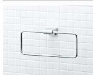
樹脂アクセサリートowelリング KF-AA70C

※各写真・イラストはイメージです。見横内容とは異なる場合がありますので、ご注意ください。