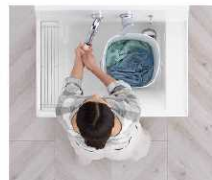
つけ置き洗い中も、バケツを避けての手洗いもOK