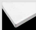
□ H アレン材#01