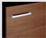
□ LM2 クリエッド