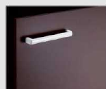
□ VR1 ブラク