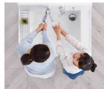
2人並んでの身支度もスムーズ