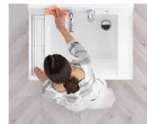
汚れにくくお掃除もカンタン