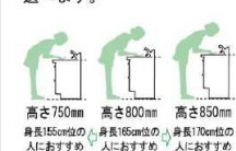
高さ750mm 高さ800mm 高さ850mm 身長155cm位の人におすすめの、身長165cm位の人におすすめの、身長170cm位の人におすすめの