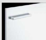
□ VP1 初イ