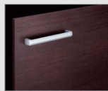
□ LD2 クリエーク