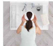
洗顔・洗髪もゆったりスペースで