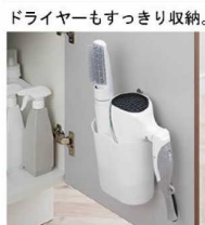
ドライヤーもすっきり収納。