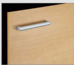
□ LP2 クイエール