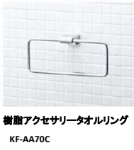
樹脂アクセサリートowelリング KF-AA70C

※各写真・イラストはイメージです。見積内容とは異なる場合がありますので、ご注意ください。