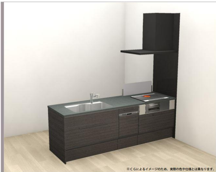
※C Gによるイメージのため、実際の色や仕様とは異なります。